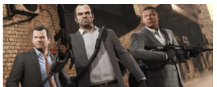
GTA 5 foi o último da franquia: jogo saiu na geração do PS3, mas chegou nas atuais máquinas