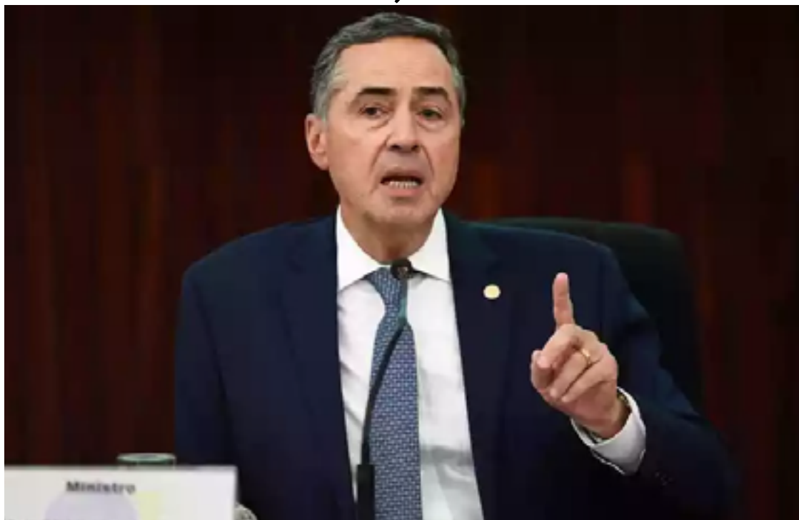
Luiz Barroso: defesa da democracia e do estado pleno de direito no país

O magistrado ainda rechaçou ataques ao Tribunal e deu o recado a parlamentares de que mexer no STF 'não parece ser um capítulo prioritário das mudanças que o País precisa'. "A democracia e a Constituição ao longo dos 35 anos têm resistido a tempestades diversas, que foram dos escândalos de corrupção às ameaças mais recentes de golpe. A Constituição e a democracia conseguiram resistir