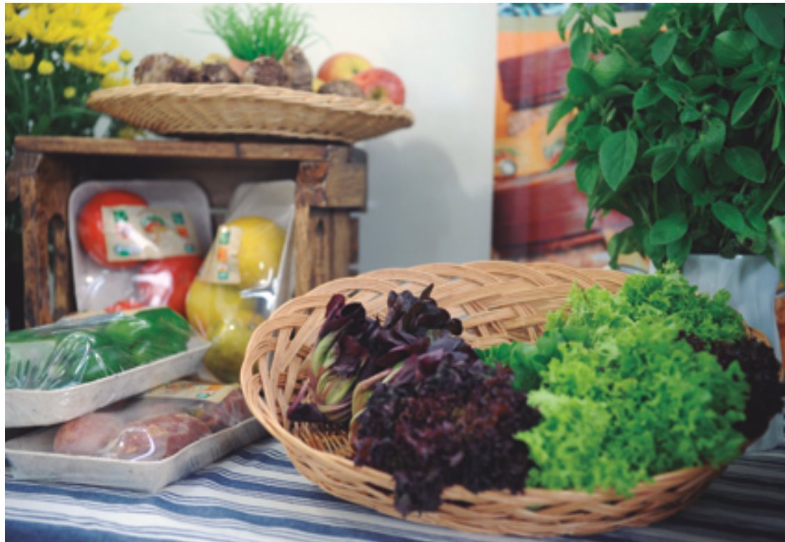
Alimentação variada, rica em vitaminas, minerais e antioxidantes, receita natural para evitar várias doenças

Diante da preocupação com a saúde e o bem-estar masculinos, é fundamental ressaltar a conexão entre a dieta e a prevenção de enfermidades do trato urológico, abrangendo o câncer de próstata. “Isso porque a alimentação variada, rica