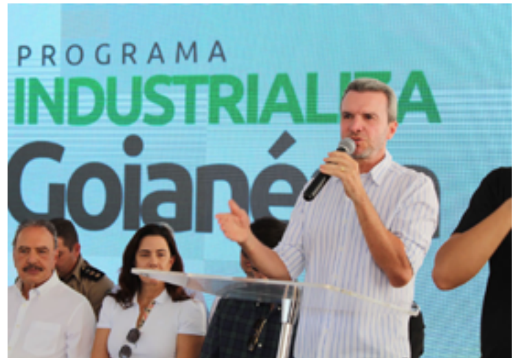
Carlos Veículos: geração de empregos e renda