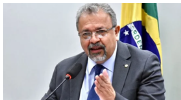
Elias Vaz: erro ao receber do Ministério mulher de narcotraficante do Amazonas

Vaz ainda afirmou ter sido repreendido por Dino. "Ele