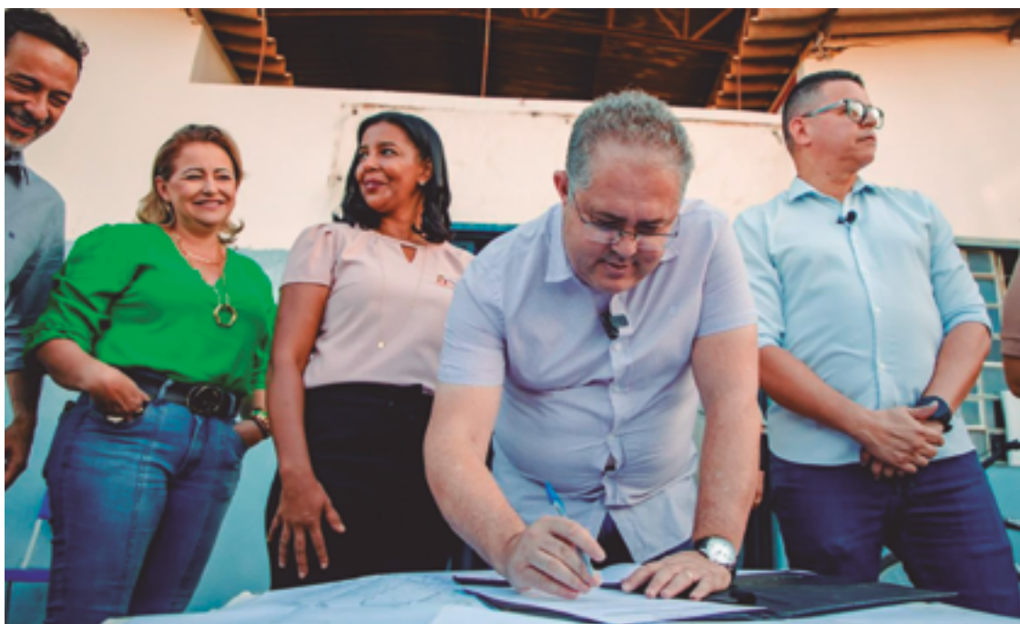
Prefeito em exercício, Márcio Cândido, ao lado de autoridades e moradores da região, assina ordem de serviço

de aula com capacidade de proporcionar acolhimento adequado para todas as crianças, atendendo a todos os perfis, pois a nova estrutura terá acessibilidade e climatização, fundamental em uma cidade com longos períodos