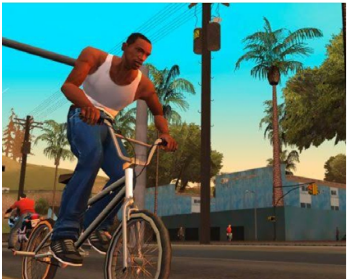
GTA San Andreas tornou-se um dos jogos mais aclamados da história: narrativa complexa