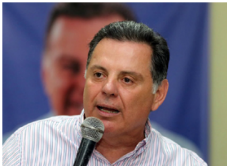
Marconi Perillo: comando do PSDB nacional