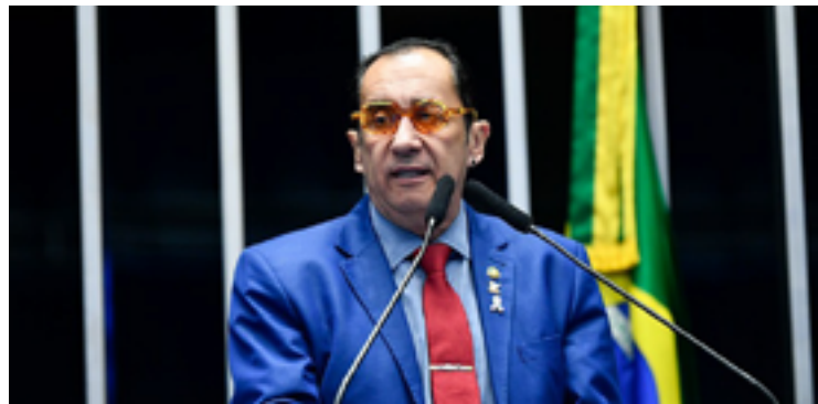
Jorge Kajuru: cuidados preventivos com Inteligência Artificial