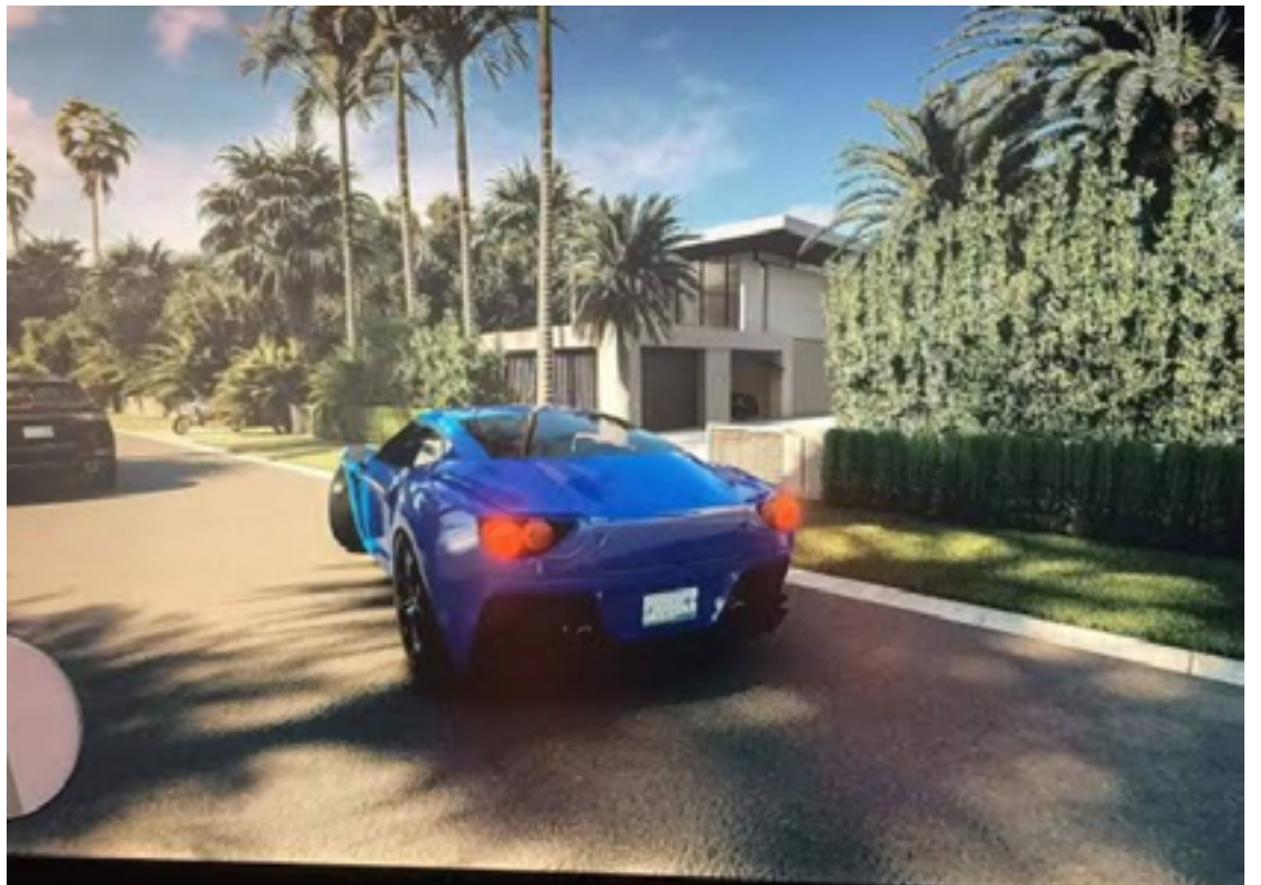
Imagens vazadas do GTA 6: possibilidades reais do jogo ser o mais caro da história, na casa dos R$ 2 bilhões

O game chegaria aos consumidores pelo dobro do custo cobrado atualmente, batendo os R$ 750.