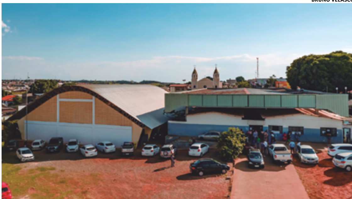
Em funcionamento desde 2003, a escola atende 500 estudantes e, com a reconstrução, terá capacidade para 700